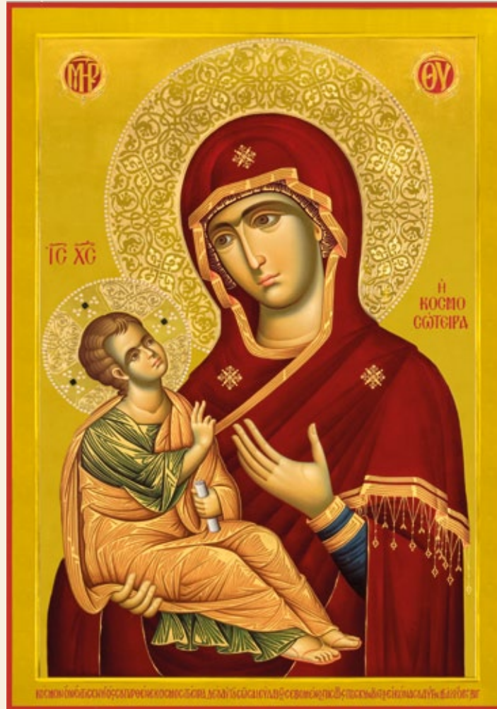
«Παναγία ἡ Κοσμοσώτειρα» Ἔργο Πατέρων Ἱεροῦ Κελλίου Ἀγ. Νικολάου Μπουραζερίου, Ἄγιον Ὄρος.