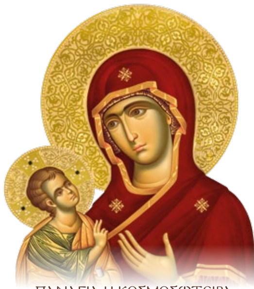
ΠΑΝΑΓΙΑ Η ΚΟΣΜΟΣΩΤΕΙΡΑ